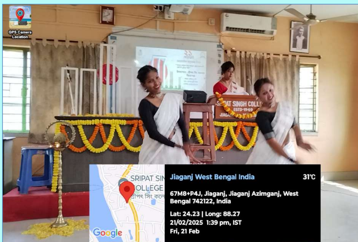
Pic. 6 Dance performed by students