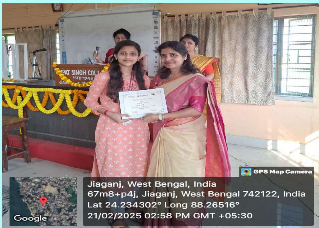
Pic. 8 Certificate Distribution