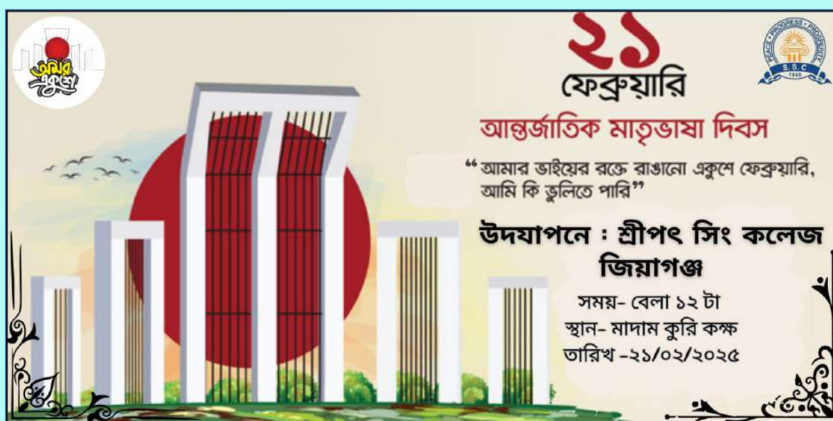
Pic. 1 Banner of the program